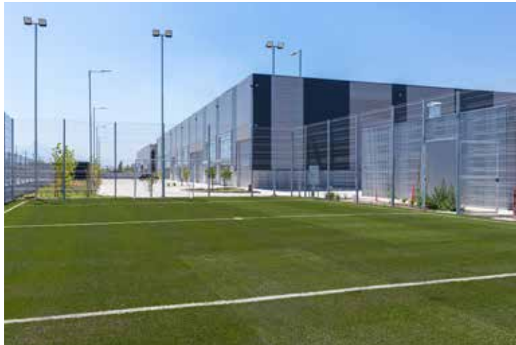
CANCHA DE BABY FÚTBOL